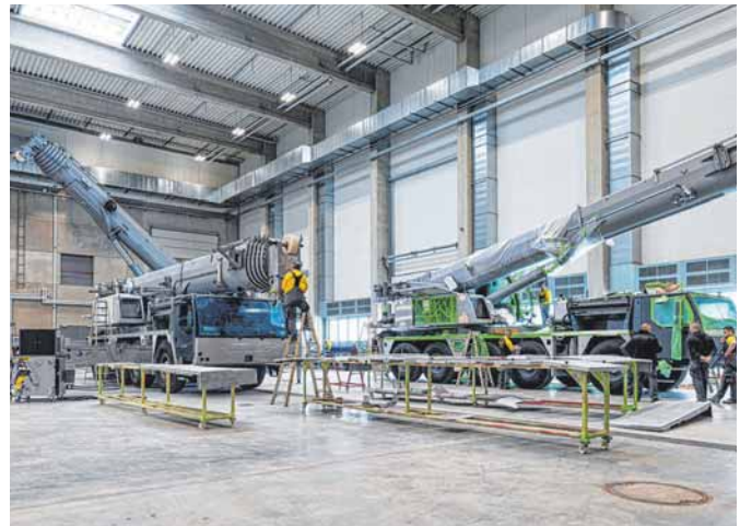
Die Flächen und Höhen des neuen Lackierzentrums sind so bemessen, dass Großfahrzeuge lackiert werden können.