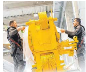
Heute arbeiten 60 Mitarbeiter im Lackierzentrum Ott.