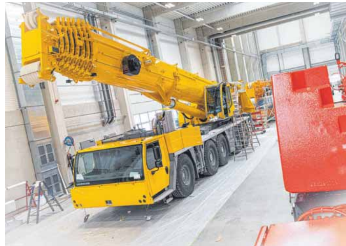
Die Flächen und Höhen des neuen Lackierzentrums sind so bemessen, dass Großfahrzeuge lackiert werden können.